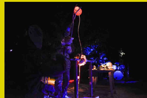
Raku Punk